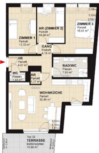
AM BEISPIEL VON TOP 32

WOHNNUTZFLÄCHE 89,73 m 2 TERRASSE 10,88 m 2